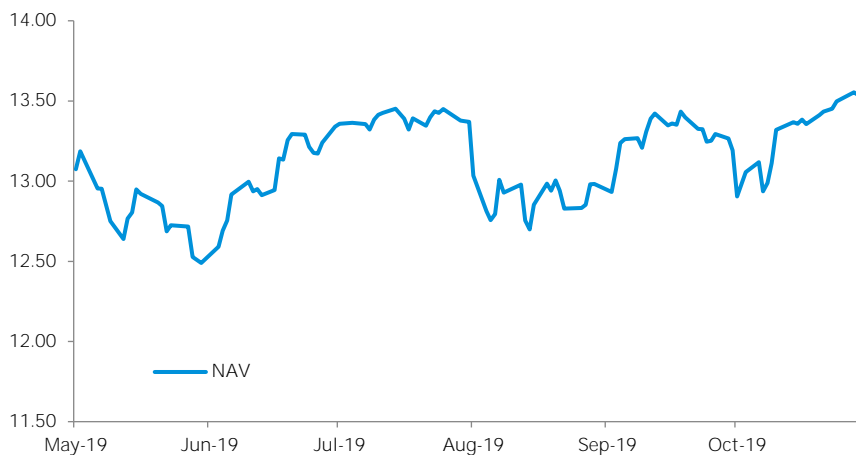
Principal Global Equity Fund (Class A)

สุดท้ายนี้ บลอ. พรินซิเพิล ขอขอบคุณท่านผู้ถือหน่วยลงทุนทุกท่าน ที่ได้มอบความไว้วางใจลงทุนในกองทุนรวมของ บลอ. พรินซิเพิล