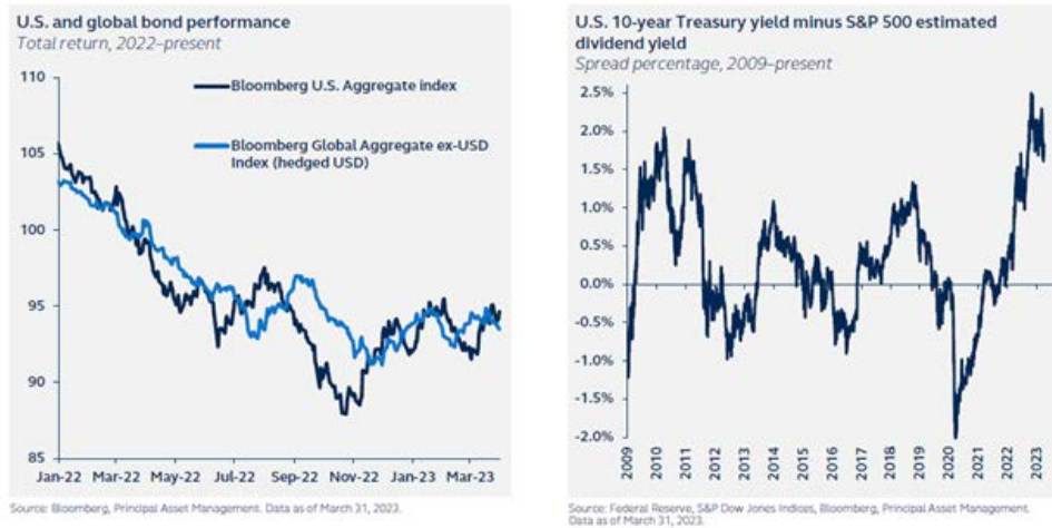
Source: Global Asset Allocation Viewpoints 2Q2023, Principal Asset Allocation. Data as of 31 March 2023.