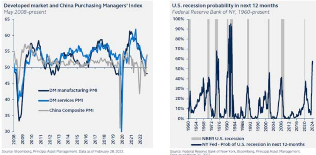
Source: Global Asset Allocation Viewpoints 2Q2023, Principal Asset Allocation. Data as of 31 March 2023.