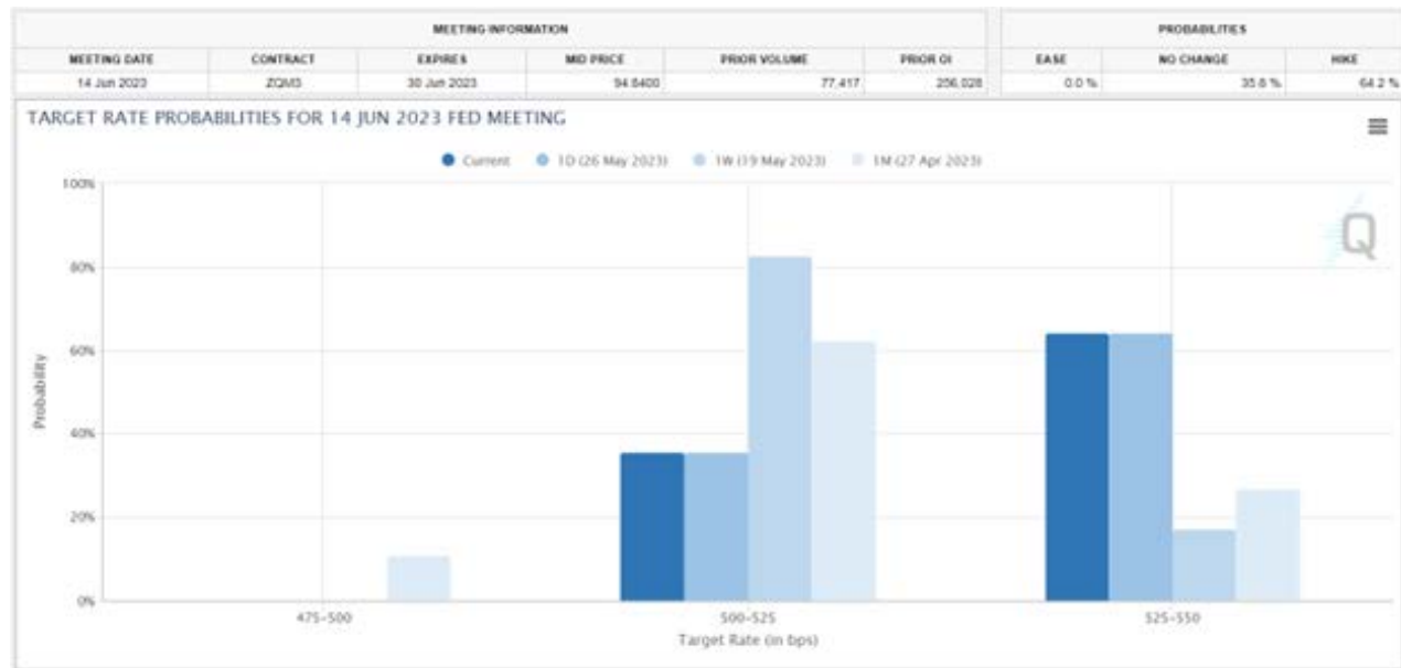
Chart: CME FedWatch Tool for 14 June 2023 FOMC meeting